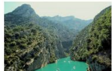
Gorges du Verdon