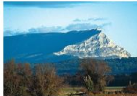
Montagne Ste Victoire