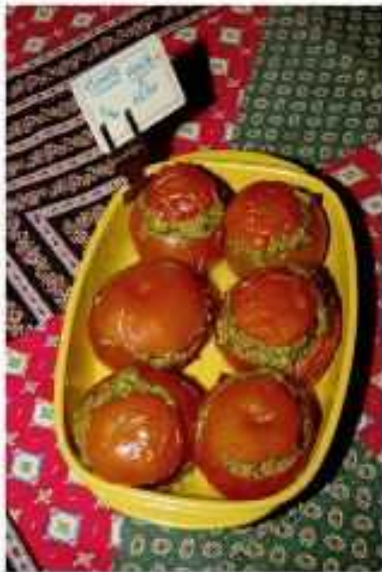
Tomates à la Provençale

La Provence c'est aussi, des habitudes alimentaires différentes du reste de la France non méditerranéenne, qui sont remarquées pour leurs parfums et pour leurs qualités (huile d'olive, herbes, ail, tomate, légumes variés, viandes mijotées et poissons frais...).. Sans oublier les vignobles et leurs vins comme les Côtes de Provence, Côtes du Rhône, Gigondas, Châteauneuf-du-Pape et bien sur l'indispensable pastis que l'on mélange avec de l'eau pour l'apéro.