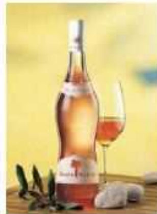
Côtes de Provence