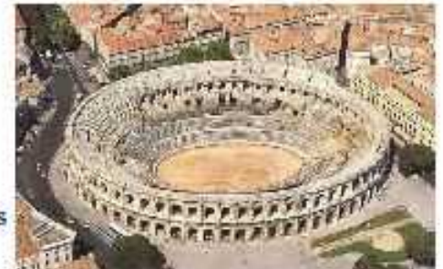
Les arènes de Nîmes