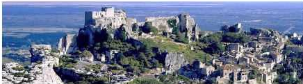
Les baux de Provence